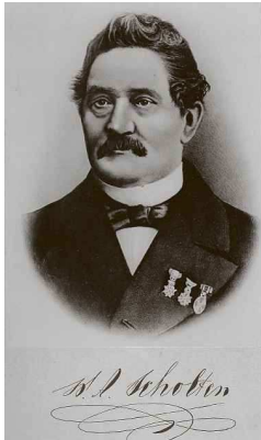
Willem Albert Scholten (1819-1892) wordt gezien als Nederlands eerste multinational.

Behalve vader Willem Albert drukt ook zoon Jan Evert Scholten een zware stempel op het familieconcern. Jan Evert (1849-1918) erfde in 1892 van zijn vader een enorm vermogen, waarmee hij in één klap behoort tot de rijkste mensen van Nederland. Hij zet het bedrijf voort en breidt verder uit in onder meer suiker, stro- en turfkarton en veenontginning. In Friesland richt hij in 1911 de Lijmpop op, de Leeuwarder IJs en Melk Poeder Fabriek. Na een periode van stevige bloei werden in de jaren vijftig diverse vestigingen daarvan overgenomen door de Condens-fabriek in Leeuwarden (Frische Vlag) en DOMO in Bellen, thans allemaal FrieslandCampina. In tegenstelling tot zijn vader toont Jan Evert Scholten een groot maatschappelijk besef. Hij is actief als gemeenteraadslid en zit als senator in de Eerste Kamer. Hij staat midden in het leven: voor zijn personeel en de burgerij richt hij allerlei recreatieve voorzieningen op, voor handvaardigheid, sport, muziek of toneel. Hij maakt zich sterk voor openbare straatverlichting en laat een omvangrijk volkstuincomplex aanleggen. Ook neemt hij het initiatief voor de toetische ontwikkeling van het Paterswoldsemeer; er verrijzen chique gebouwen ten behoeve van de zeilsport en de weg erheen wordt geasfalteerd. Hij schenkt Groningen in 1911 het Stadspark en zijn drafbaan, de aanleg wordt voltooid in 1926. Zijn buste staat er als dank op een centrale plek.